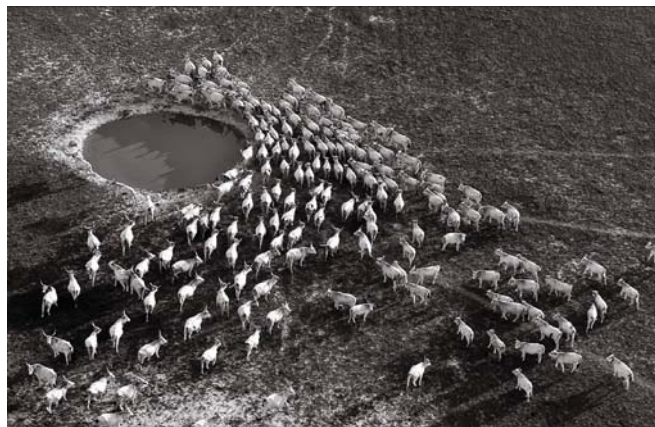
Kirájak József: Ökörzem

vész. A kiállítás megtekinthető: 2013. április 1-ig hétfőtől-péntekig 10-17 óráig